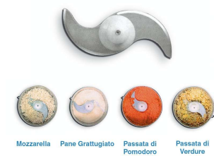
Mozzarella Pane Grattugiato Passata di Pomodoro Passata di Verdure